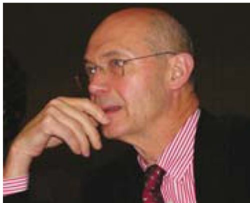
– Norge må gi slipp på beskyttelsen av norske særrettigheter, sier Pascal Lamy

”Norge kan ikke forvente å selge fisk som dere har mye av til andre uten hindringer og til høy pris, samtidig som dere stenger ute andre matvarer som andre har god ressurstilgang på. Dere må gi slipp på beskyttelsen av norske særrettigheter, hvis ikke Norges ry som solidarisk og rettferdig land skal forsvinne”, sa generaldirektør Pascal Lamy i WTO på NHOs årskonferanse nylig.