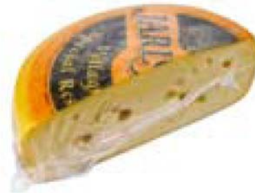
Eksporten av ost støttes med om lag 50 kroner per kilo.

En annen årsak til det høye kostnadsnivået er at det fremdeles er betydelige problemer med overproduksjon i norsk jordbruk. I 2003 ble det for eksempel eksportert melkeprodukter tilsvarende 190 millioner liter melk, eller 12 % av produksjonen, til priser som var betydelig under produksjonskostnadene. Tapet knyttet til denne eksporten var på om lag 900 millioner kroner.